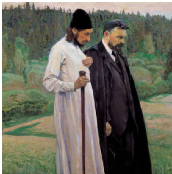
Pavel Florenskij e Sergej N. Bulgakov

scrive: «il sangue e l'acqua di Cristo sgorgati dal costato rimangono nel mondo, in un certo senso separati dal suo corpo sepolto, risorto, asceso al cielo, che siede alla destra del Padre», sì che la natura umana di Cristo risulta «per così dire sdoppiata in celeste e terrena» (p. 82). Ciò significa che l'umiliazione di Cristo continua anche dopo l'Ascensione e che essa consiste nella condivisione della sofferenza umana. La teologia deve riconoscere non solo «la sofferenza redentrice per noi» ma anche «la sofferenza di Cristo con noi» (p. 89), giacché, si domanda il teologo russo: «la salvezza universale, data per tutti, compiutasi in Cristo, lascia forse ora il cielo indifferente e apatico alla sofferenza della terra?» (p. 86).